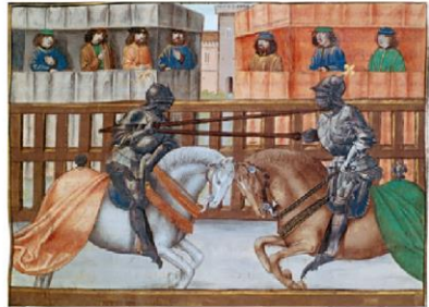
Henriette Bichonnier, Émilie et le crayon magique , © Le Livre de Poche Jeunesse 1979, 2001.

8 ** Cherche les mots en gras dans un dictionnaire. Recopie la définition qui correspond au sens de la phrase. Face à face, les deux adversaires s'observent un instant à travers les fentes de leur heaume. Les chevaux piaffent d'impatience, la foule retient son souffle. Soudain, le signal donné, c'est l'affrontement. Les deux champions lancent leur destrier. Pendant quelques secondes, dans un silence de mort, on n'entend plus que le cliquetis des armes et le martèlement des sabots.