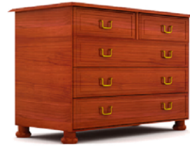
Dictionnaire Larousse Super Major, © Larousse 2015.

2 commode n. f. Meuble bas à tiroirs dans lequel on range du linge.