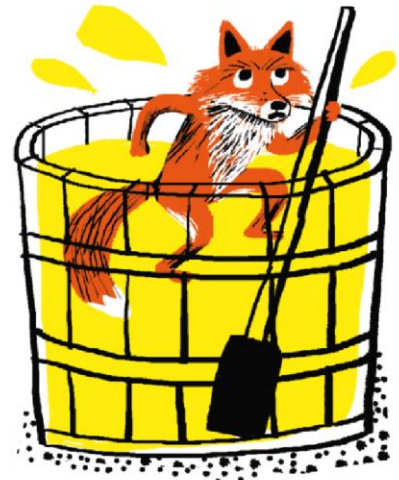
Jean Muzi, « Renard change de couleur », in Dix-neuf fables de renard , © Flammarion.

L'artisan venait de délayer de la teinture jaune dans une grande cuve pleine d'eau et il était sorti de la pièce pour aller chercher le tissu qu'il souhaitait teindre . Renard pénétra dans la cour, persuadé de trouver quelque chose pour calmer sa faim. Il monta sur le rebord de la fenêtre qui était ouverte et observa quelques instants. N'apercevant personne dans la pièce, il sauta rapidement à l'intérieur. Dans sa hâte, il ne put éviter la cuve où il atterrit sans le vouloir. La cuve était profonde et Renard dut se débattre pour éviter la noyade. Sur ces entrefaites, le teinturier revint.